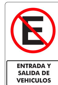
ENTRADA Y SALIDA DE VEHÍCULOS