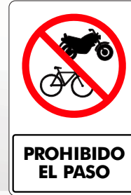
PROHIBIDO EL PASO ( BICICLETAS Y MOTOCICLETAS )