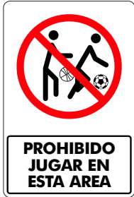
PROHIBIDO JUGAR EN ESTA ÁREA