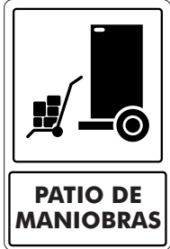
PATIO DE MANIOBRAS