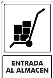
ENTRADA AL ALMACÉN