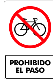
PROHIBIDO EL PASO ( BICICLETAS )