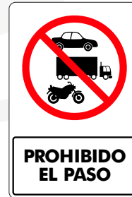
PROHIBIDO EL PASO ( TODOS LOS VEHÍCULOS )