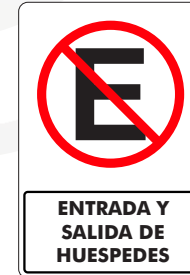
ENTRADA Y SALIDA DE HUESPEDES