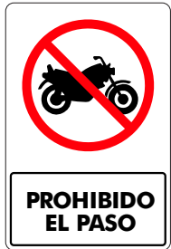
PROHIBIDO EL PASO ( MOTOCICLETAS )