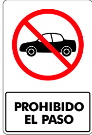
PROHIBIDO EL PASO ( AUTOS )