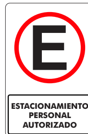
ESTACIONAMIENTO PERSONAL AUTORIZADO