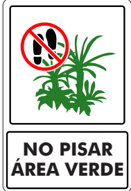
NO PISAR ÁREA VERDE