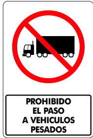
PROHIBIDO EL PASO A VEHÍCULOS PESADOS