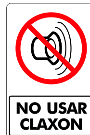
NO USAR CLAXON