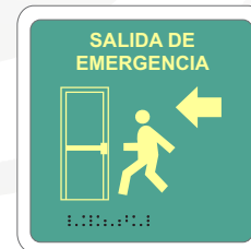
SALIDA DE EMERGENCIA / FLECHA IZQUIERDA