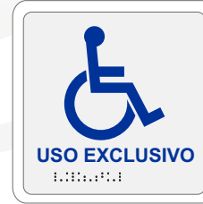
USO EXCLUSIVO / PERSONAS CON DISCAPACIDAD