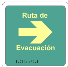
RUTA DE EVACUACIÓN / FLECHA DERECHA