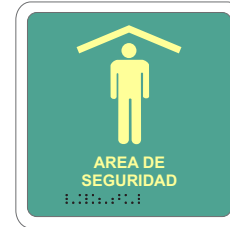
ÁREA DE SEGURIDAD