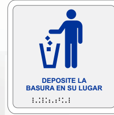
DEPOSITE LA BASURA EN SU LUGAR