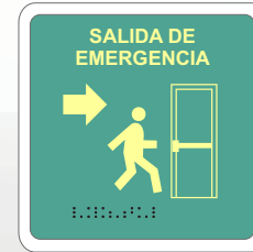
SALIDA DE EMERGENCIA / FLECHA DERECHA