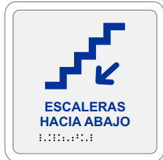
ESCALERAS HACIA ABAJO