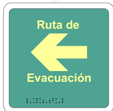
RUTA DE EVACUACIÓN / FLECHA IZQUIERDA