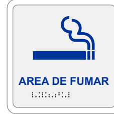
ÁREA DE FUMAR